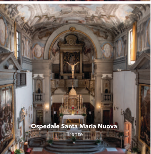
Ospedale Santa Maria Nuova Firenze