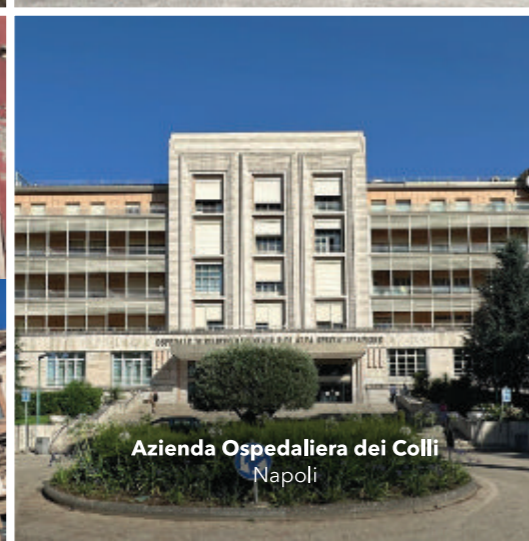
Azienda Ospedaliera dei Colli Napoli

ACOSI vuole promuovere l'adesione ed essere un punto qualificato di riferimento per le istituzioni che hanno dato un contributo significativo nelle vicende storiche fondanti dell'organizzazione sanitaria del nostro Paese.