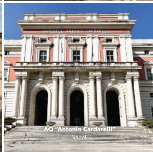
AO "Antonio Cardarelli" Napoli