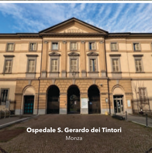
Ospedale S. Gerardo dei Tintori Monza