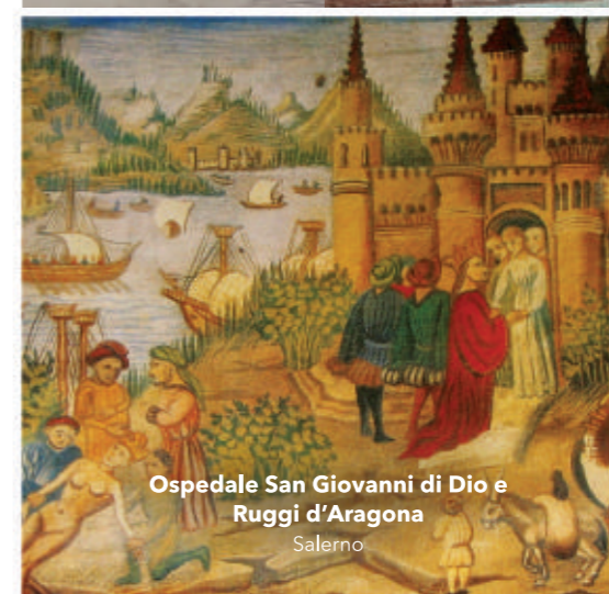
Ospedale San Giovanni di Dio e Ruggi d'Aragona Salerno