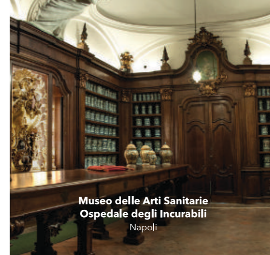
Museo delle Arti Sanitarie Ospedale degli Incurabili Napoli

ACOSI ha la sua sede legale a Firenze; i suoi organi sono l' Assemblea , il Consiglio Direttivo , il Comitato Scientifico .