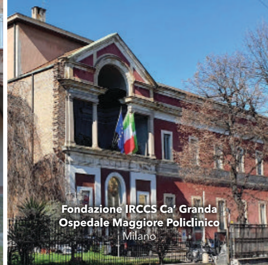
Fondazione IRCCS Ca' Granda Ospedale Maggiore Policlinico Milano