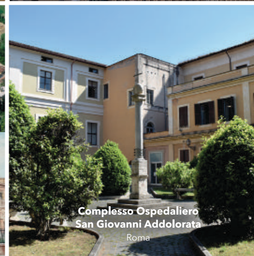
Complesso Ospedaliero San Giovanni Addolorata Roma