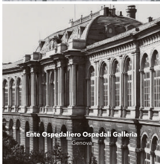
Ente Ospedaliero Ospedali Galliera Genova