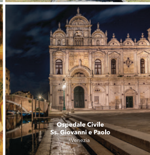
Ospedale Civile Ss. Giovanni e Paolo Venezia