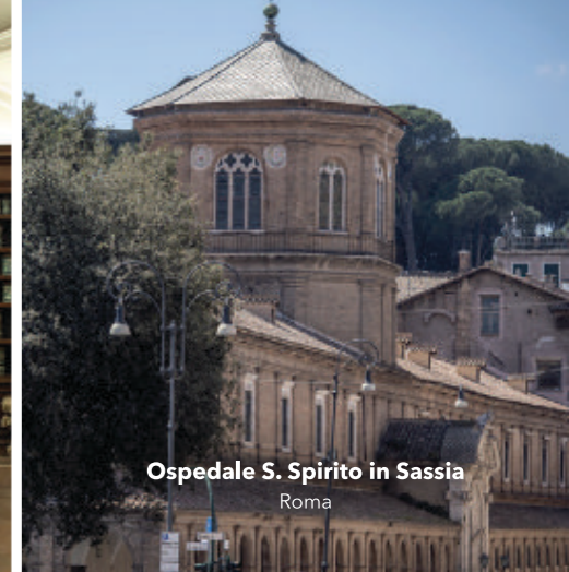
Ospedale S. Spirito in Sassia Roma