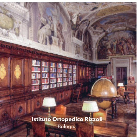
Istituto Ortopedico Rizzoli Bologna