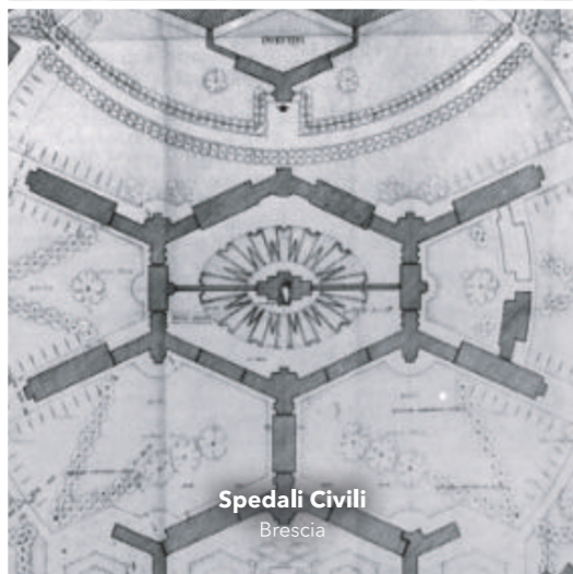
Spedali Civili Brescia